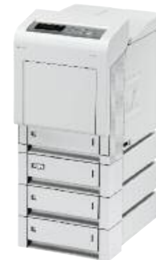
Abbildung mit optionalem Zubehör.

Änderungen in Ausstattung und Konstruktion vorbehalten.